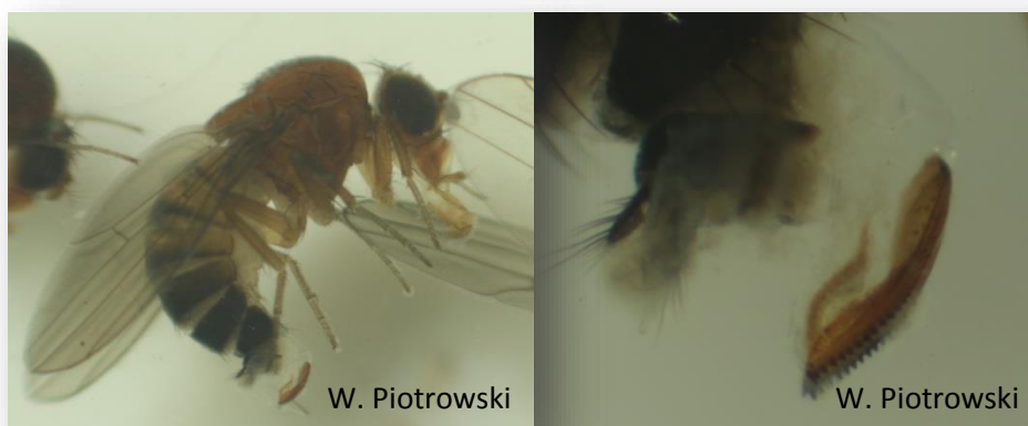
Rys. 6. Samica i jej pokładelko

W przypadku problemów z identyfikacją zapraszamy do kontaktu z autorami niniejszego opracowania.