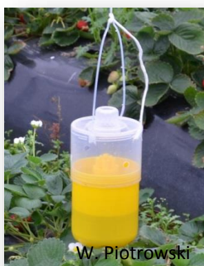
Rys. 10. Hiszpańska pułapka.