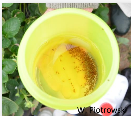
Rys. 9. Polski płyn wabiący.