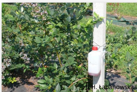
Rys. 7. Pułapka do odłowu D. suzukii wykonana przez sadownika (Włochy).

Do monitoringu D. suzukii można wykorzystać pułapki i płyn wabiący wykonany we własnym zakresie według receptury włoskiej. Pułapkę można wykonać np. z czworokątnej butelki/pojemnika typu PET o pojemności 1,0-1,5 l, z szeroką szyjką. W górnej części należy wywiercić kilka małych otworów- średnicy 2-3 mm z 3 stron, przez które mogą wchodzić odławiane muchy, wlać płyn i zamknąć (rys. 7). Jako płyn wabiący można stosować mieszaninę np. 200 ml octu winnego (jabłkowy) + 50 ml czerwonego wina, która wabi muchy. Tak przygotowane pułapki zawieszają się na grubszych pędach krzewów lub na specjalnych kołkach bądź na drutach (jeśli tak prowadzona jest uprawa) na plantacji. Pułapki umieszcza się na wysokości owocowania krzewów.