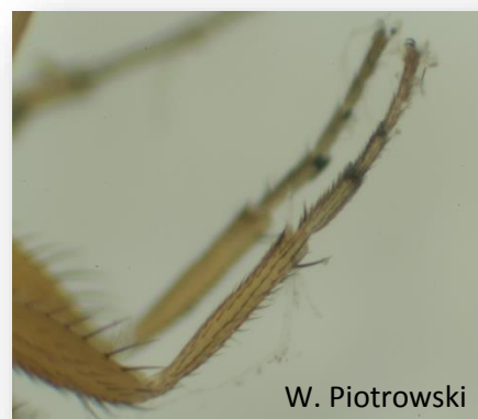
Rys. 5. Samiec – grzebień na odnóżach