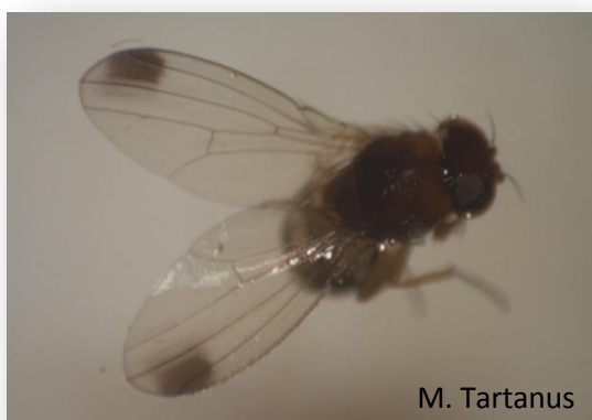
Rys. 4. Samiec – plamki na skrzydłach

jest silne, ząbkowane pokładelko, którym nacinają skórę owocu podczas składania jaj do jego wnętrza.