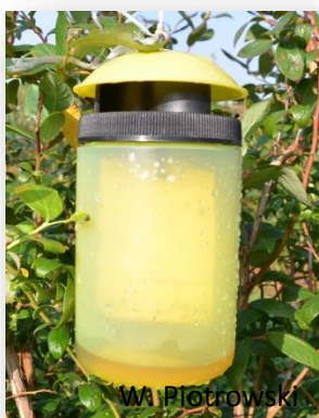
Rys. 8. Polska pułapka.

Można też wykorzystać dostępne komercyjnie pułapki i płyn przygotowane np. przez firmę ICB Pharma z Jaworzna ( www.icbpharma.pl ), lub inne które zapewne pojawią się na rynku. W 2014 r. muchy D. suzukii odłowiliśmy w pułapki z płynem wabiącym uzyskanym z polskiej firmy ICB Pharma z Jaworzna (rys. 8, 9.) oraz w pułapki z płynem wabiącym pochodzącym z firmy Bioiberica, Hiszpania (rys. 10, 11).