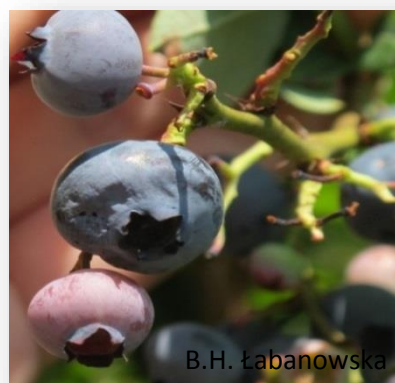
Rys. 2, 3. Owoce borówki uszkodzone przez D. suzukii , plantacja we Włoszech.

W USA stwierdzono straty w zbiorach z powodu uszkodzenia owoców przez muszkę plamoskrzydłą na poziomie 20-40%, (mimo wykonania 5-7 zabiegów chemicznych zwalczających szkodnika), natomiast we Włoszech przy dużym zagrożeniu i braku zwalczania straty plonu sięgały nawet 100%. Z drugiej strony chemiczne zwalczanie D. suzukii przeprowadzane podczas dojrzewania owoców, tuż przed zbiorem, jest niebezpieczne, gdyż mogą być one zdyskwalifikowane, ze względu na pozostałości pestycydów, które mogą przekraczać dopuszczalne poziomy.