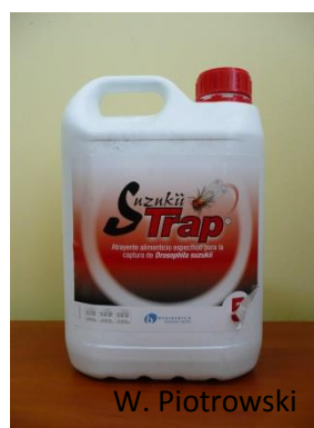
Rys. 11. Hiszpański płyn wabiący.

W sadach czereśniowych i wiśniowych pułapki należy zawieszać na wysokości 1,0-1,5 m nad ziemią, natomiast w przypadku polowej uprawy truskawki bezpośrednio nad ziemią, w taki sposób, by nie były one uszkodzane podczas zabiegów pielęgnacyjnych (np. przez belkę